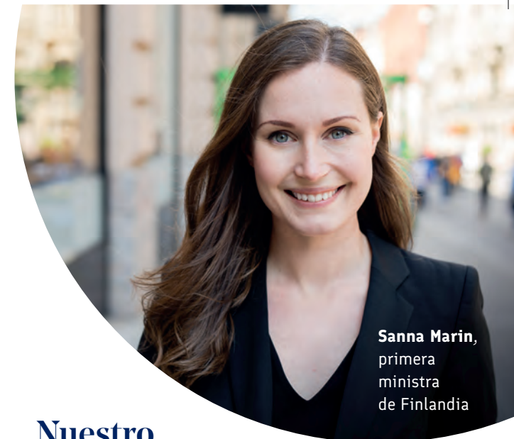
Sanna Marin, primera ministra de Finlandia

Para más información sobre nuestros compromisos y garantías, visite la página: um.fi/HRC , #FIforHRC